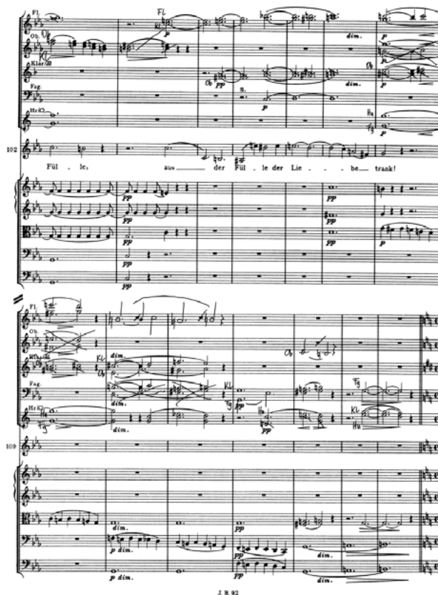
Ein Ausschnitt der handschriftlich bearbeiteten Partitur von Brahms Op. 53

Mit diesen Erfahrungen habe ich jetzt enormen Spaß auch bei meinen letzten Projekten mit dem ÖBB-Orchester, bei dem zuletzt über 90 MusikerInnen und ein Chor von 50 SängerInnen auf der Bühne waren. Natürlich wurden fast alle Stücke von mir für diesen Anlass bearbeitet und zusammengestellt.